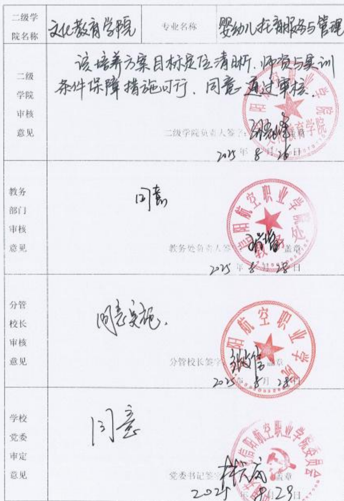
信阳航空职业学院 专业人才培养方案审定意见表